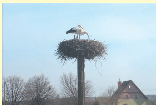
KATEGORIA 2: UDANA KOEGZYSTENCJA DZIAŁALNOŚCI GOSPODARCZEJ CZŁOWIEKA I ŚRODOWISKA NATURALNEGO. Miejsce 1: Bociany – autor Wioletta Siwak.