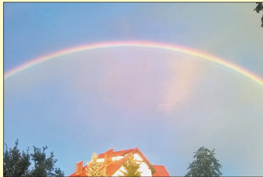
Miejsce 2: Tęcza – autor Martyna Szczęsna.