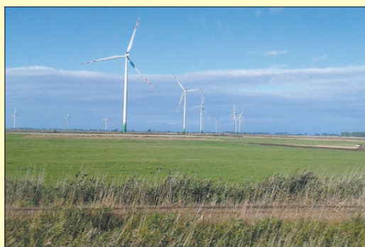
Miejsce 2: Wiatraki – autor Kamil Szulc.