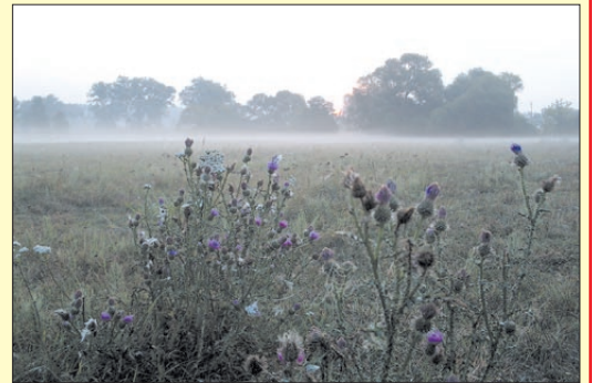
Miejsce 3: Łąka – autor Ewelina Guzdaj.