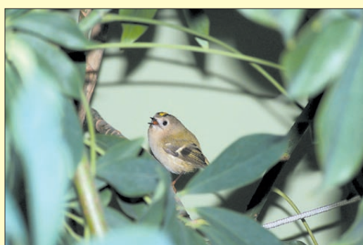
WYRÓŻNIENIA: Zdjęcie pt. Mysikrólik – autor Renata Tkaczyk.